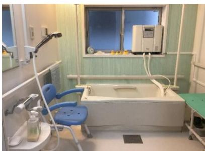
ほっとひと息つけるあたたかな入浴時間を