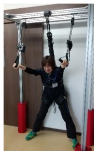
新たに加わったトレーニングスペース